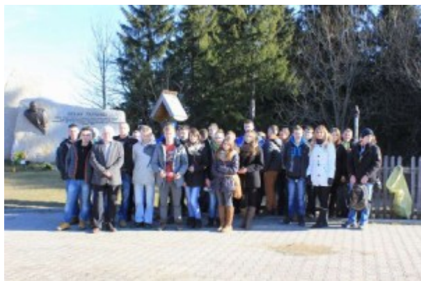
Zajęcia z kompetencji społecznych