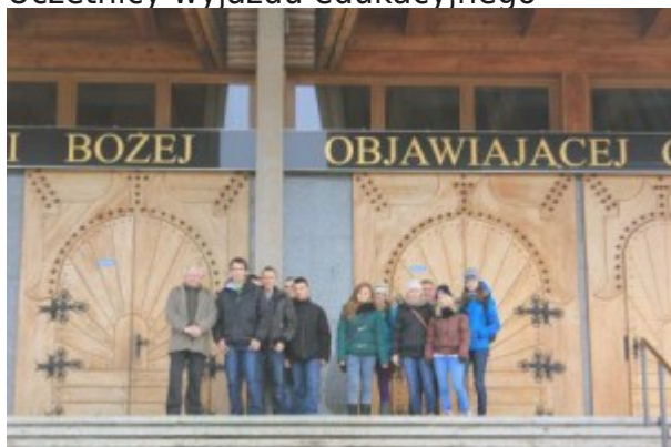
Zajęcia z ICT