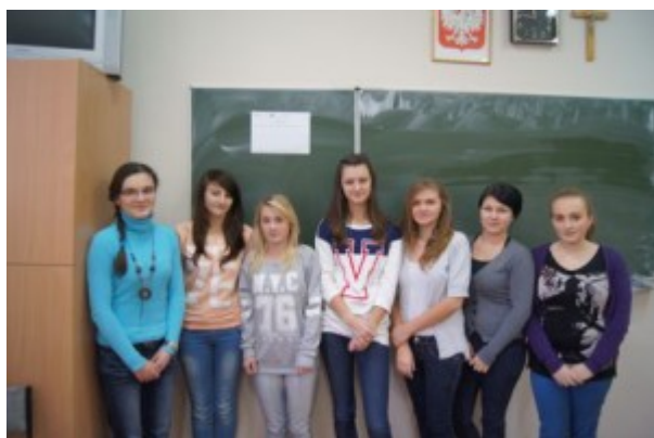
Zajęcia z przedsiębiorczości